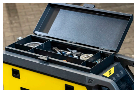
Caja de herramientas opcional para accesorios