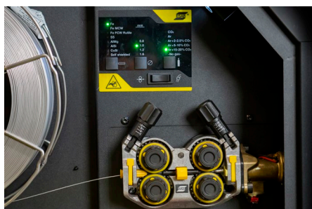
El mejor mecanismo de alimentación de hilo de su categoría